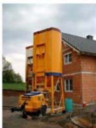
Konventionell – Zement – Anhydritestrich