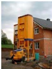
Konventionell – Zement – Anhydritestrich